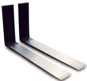
Garfo Polido com Chanfro Inteiro